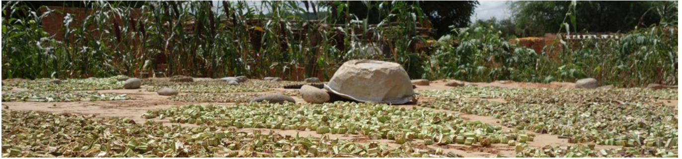
OMD 1 : Séchage traditionnel à l'air libre de gombo