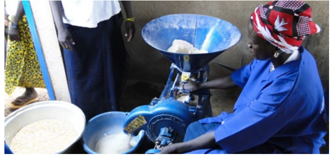
OMD 1 : La moulin à grain simplifie la mouture du millet