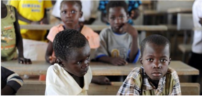
OMD 2 : La prochaine génération à l'école